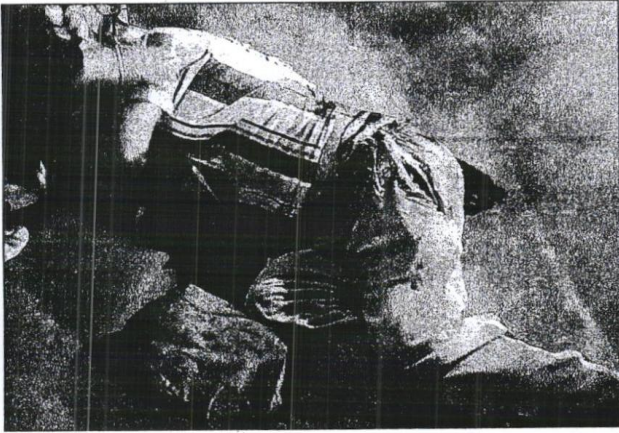
■ মর্মান্তিক: ছিটকে পড়েছেন বাপনবাবু। সোমবার। ছবি: স্বাতী চক্রবর্তী

গত এক সপ্তাহ ধরে শহরের বিভিন্ন প্রান্তে বাসের রেষারেষিতে পরপর মৃত্যুর ঘটনা ঘটলেও বাস চালকেরা সতর্ক হচ্ছেন না বলেই অভিযোগ। সম্প্রতি কলকাতার পুলিশ কমিশনার অনুজ শর্মাও ট্র্যাফিক অধিকারিকদের কাছে বাসের রেষারেষি ঠেকানোর পরামর্শ চেয়েছেন। বেপরোয়া গতিতে বাস চালালে লাইসেন্স সাময়িক ভাবে বাতিলের উপরেও জোর দিয়েছে পুলিশ। কিন্তু তাতে যে কাজের কাজ কিছুই হচ্ছে না এ দিনের ঘটনা তা তোখে আঙুল দিয়ে দেখিয়ে দিল।